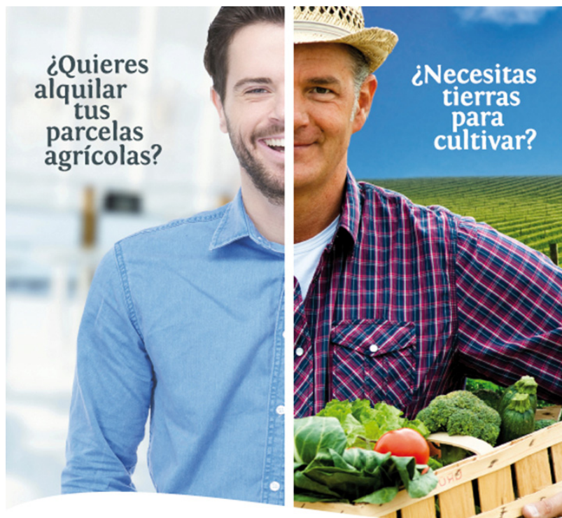
Imagen representativa del plan de comunicación

Bancos de Tierras de la Provincia de Valencia: La unión perfecta para arrendar terrenos agrícolas